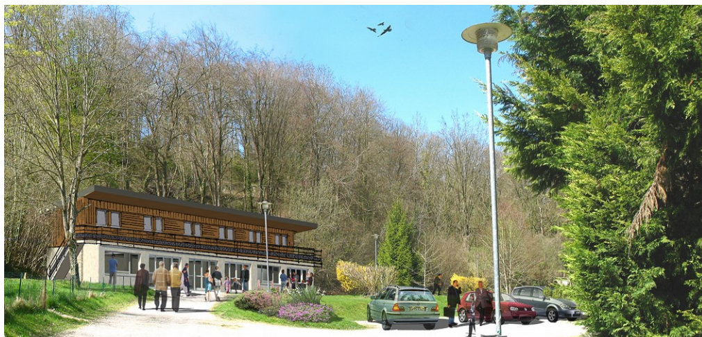
Vue virtuelle du futur gîte

Les travaux du futur gîte de groupe ont débuté fin mai. Il comprendra 21 lits, répartis en 6 chambres à l'étage plus la petite maison à côté de la salle qui sera équipée pour répondre aux normes d'accessibilité aux handicapés. Il sera labellisé Gîte de France, Tourisme Handicap et Accueil Vélo . La durée des travaux est estimée à 8 mois.