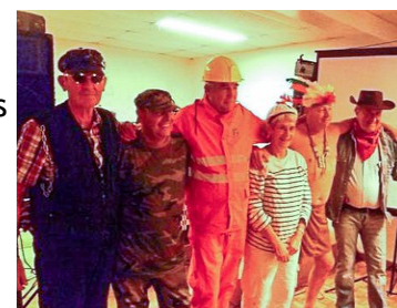
...les maires aussi

Deux associations boncourtoises ont très activement participé au bon déroulement de cette manifestation : « Vivre à Boncourt » et « les Copains d'abord Cyclos Boncourt 28 » en prêtant leur concours à différents stades de l'organisation. C'est une belle preuve de dynamisme qui règne dans la commune, de l'entraide aussi qu'on peut y développer. .. et les résultats obtenus sont vraiment à la hauteur.