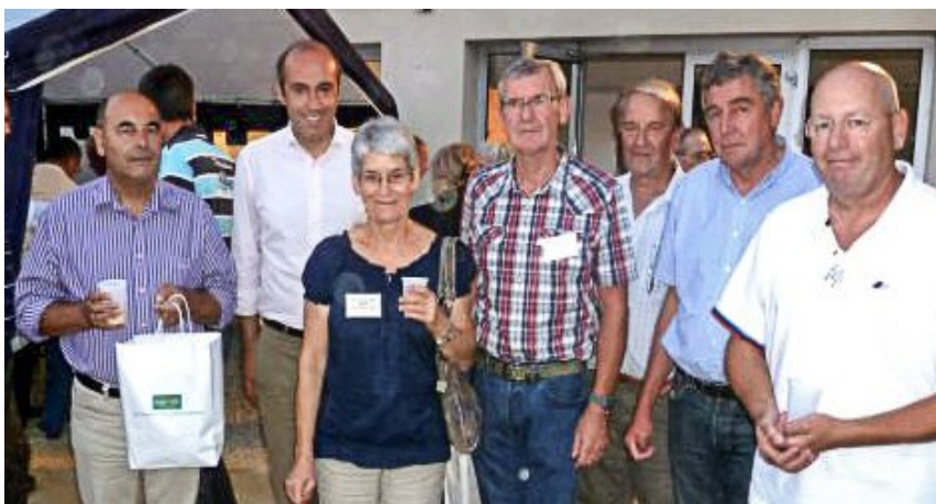
Les maires des six communes avec Olivier Marleix